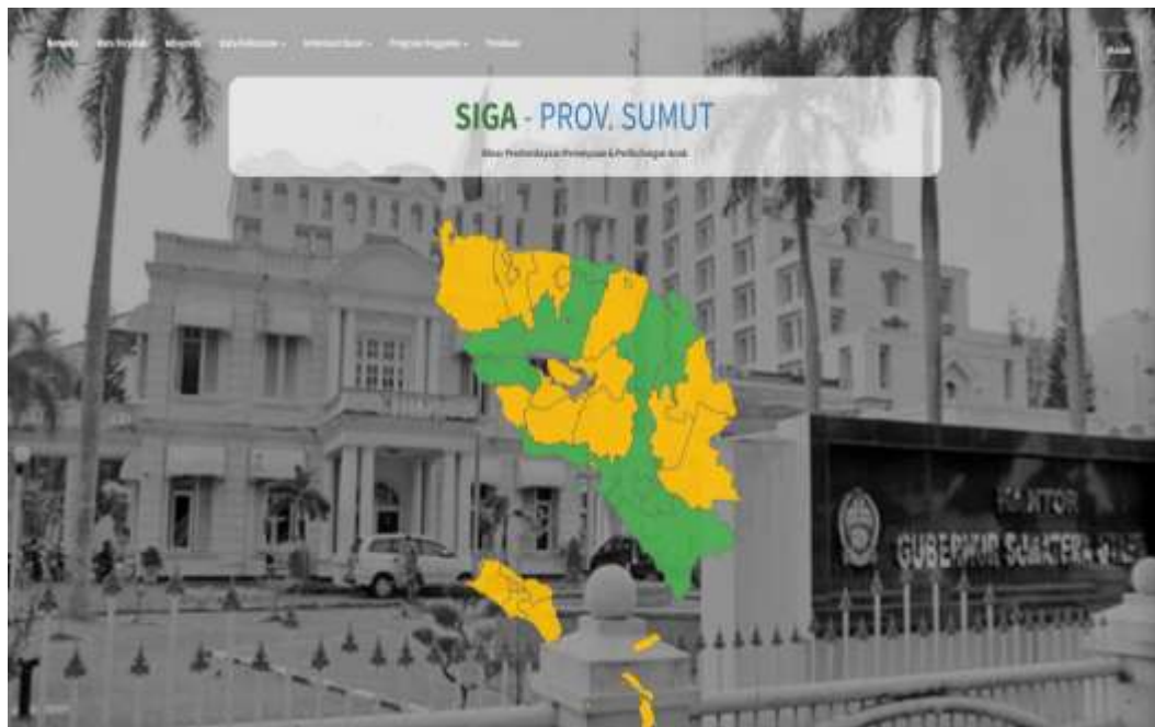
Gambar 2. Tampilan Muka/depan Sistem Informasi Gender dan Anak (SIGA/ siga.sumutprov.go.id )