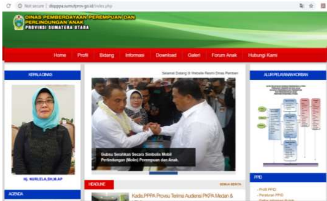
Gambar 1. Tampilan Muka/depan Website resmi Dinas Pemberdayaan Perempuan dan Perlindungan Anak Provsu ( dispppa.sumutprov.go.id )

Sumatera Utara. Dinas Pemberdayaan Perempuan dan Perlindungan Anak selaku PPID pembantu juga telah memanfaatkan layanan Sistem Informasi Publik – Pejabat Pengelola Informasi dan Dokumentasi (SIP-PPID) sebagai media informasi dan komunikasi kepada masyarakat, lembaga maupun instansi yang lain.